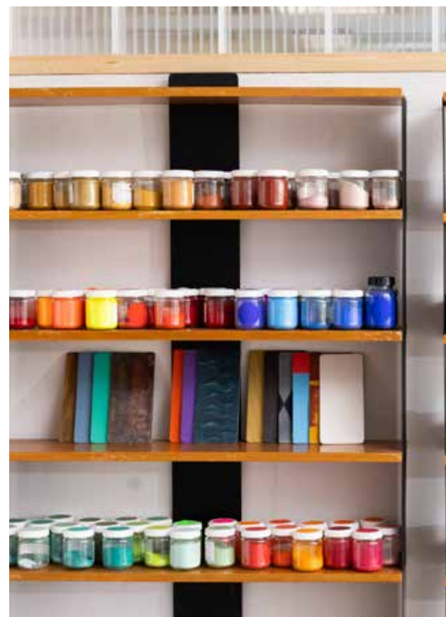
Material und Expertise stehen den Studierenden auch ausserhalb des Unterrichts zur Verfügung.

den Blick zu öffnen und mit dem eigenen Know-how die anderen weiterzubringen. Gemeinsame Ausflüge zu innovativen Handwerksbetrieben sollen die Studierenden zusätzlich inspirieren und weiter zusammenschweissen.